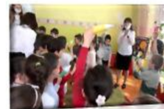
Организация питания в детском саду

Правильно организованное питание, обеспечивает нормальный рост и развитие детского организма, оказывает существенное влияние на иммунитет ребенка по отношению к различным заболеваниям, повышает его работоспособность и выносливость, способствует оптимальному нервно-психическому развитию. Меню в детском саду составляется в соответствии с рекомендациями СанПиН 2.4.1.3049-13 - «Санитарно-эпидемиологические требования к устройству, содержанию и организации режима работы в дошкольных организациях», направленные на охрану здоровья детей при осуществлении деятельности по их воспитанию, обучению, развитию и оздоровлению в дошкольных организациях. Администрацией детского сада систематически проводится работа с родителями, особенно, самых младших групп по знакомству с организацией питания в детском саду.